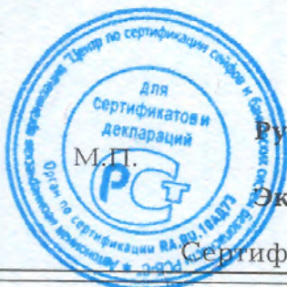
Схема сертификации - 1